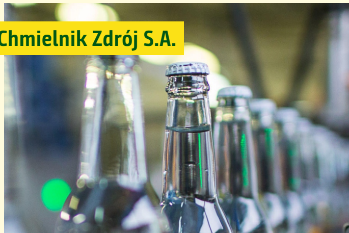
Chmielnik Zdrój S.A.