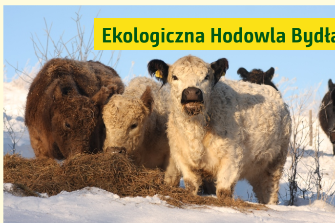
Ekologiczna Hodowla Bydła