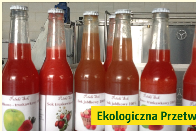
Ekologiczna Przetwórnia Owoców i Warzyw