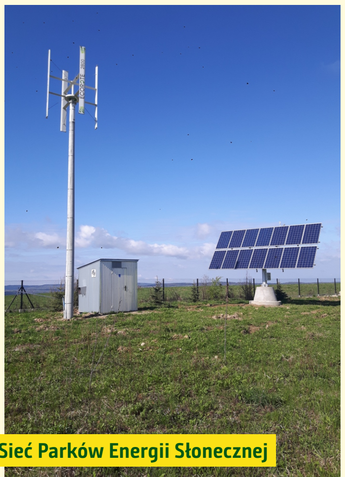
Sieć Parków Energii Słonecznej