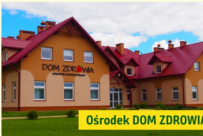
Ośrodek DOM ZDROWIA