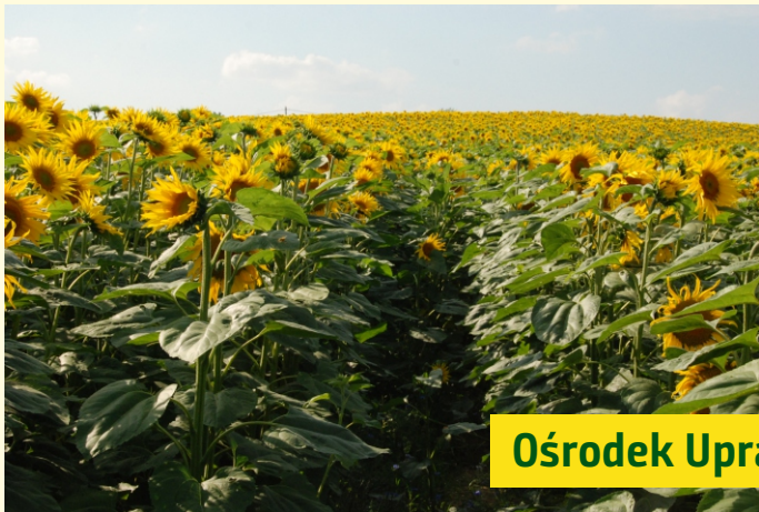
Ośrodek Upraw Ekologicznych