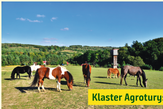
Klaster Agroturystyczny Doliny Strugu