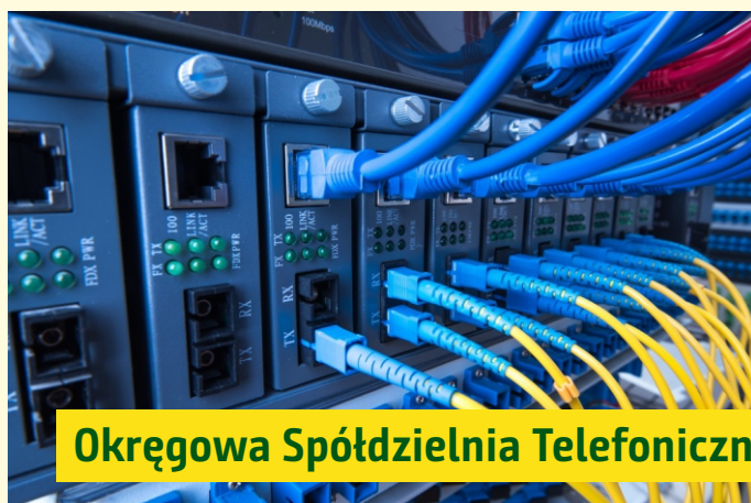
Okręgowa Spółdzielnia Telefoniczna